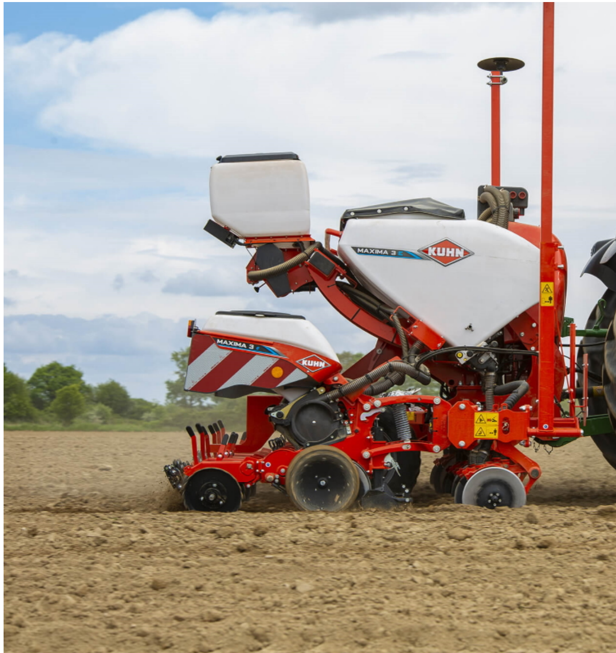
Seminatrice MAXIMA 3

«Queste soluzioni consentono di concimare al momento della semina con dosi variabili da 30 a 330 kg per ettaro (a 75 cm di distanza e secondo la velocità di avanzamento) grazie a un dosatore volumetrico a scanalature che assicura, inoltre, una distribuzione uniforme, precisa e continua su tutta la larghezza della macchina» dice Cera.