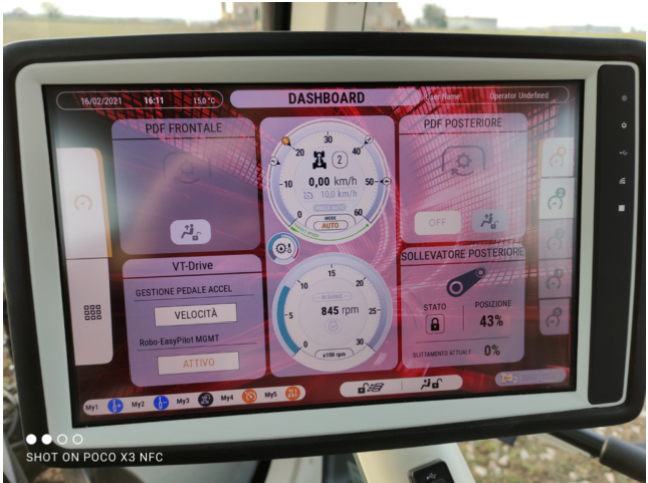
SHOT ON POCO X3 NFC