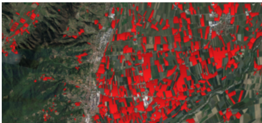
Foto 1. Meleti (in rosso) nell'area frutticola saluzzese (Cuneo), di cui rappresentano una componente dominante; ne consegue che spesso in frutteti adiacenti siano presenti cultivar compatibili

Per rendere l'impollinazione più efficiente, in alcuni dei più recenti impianti di melo è stato adottato uno schema di campo "misto" nel quale meli di cultivar differenti sono collocati alternati sullo stesso filare. Questa disposizione aumenta le possibilità che un'ape, che si muove lungo il filare, visiti i fiori di alberi di cultivar differenti con una maggiore probabilità che avvenga l'impollinazione.