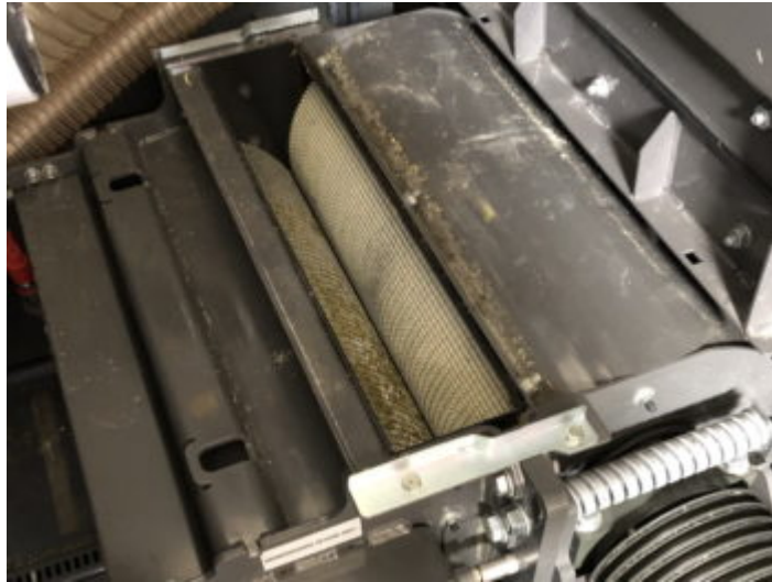
Particolare dei rulli del nuovo rompigranella; il diametro è stato aumentato da 20 a 30 cm

Alla fine del percorso il prodotto entra nel tubo di lancio la cui geometria è stata completamente rivista: tre le altezze di carico 5,85 m nella versione standard, 6,05 con un'estensione, 6,20 con 2 estensioni . Interessante la possibilità di inclinare a 90° il nuovo deflettore per uno scarico più efficace sul rimorchio; un movimento che può essere seguito dall'operatore sul display in cabina, in pieno giorno e anche nel buio della sera, grazie alla telecamera e ai fari che ruotano nella stessa direzione.